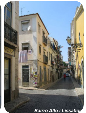
Bairro Alto i Lissabon

Fina upplevelser, goda viner och avkoppling.