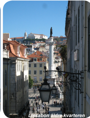
Lissabon äldre kvarteren