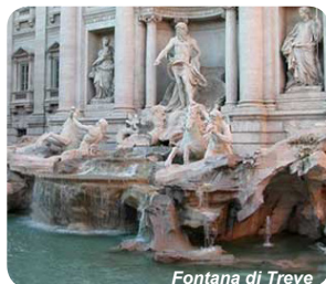
Fontana di Treve

Fontana di Trevi har spelat huvudrollen i många filmer från Rom; Tre mynt i fontänen, Prinsessa på vift och La Dolce Vita med Anita Ekberg. Det är en för Rom ganska ny fontän och den fullbordades 1762. Det sägs att om man kastar ett mynt i Fontana di Trevi kan man vara säker på att få återvända till Rom.